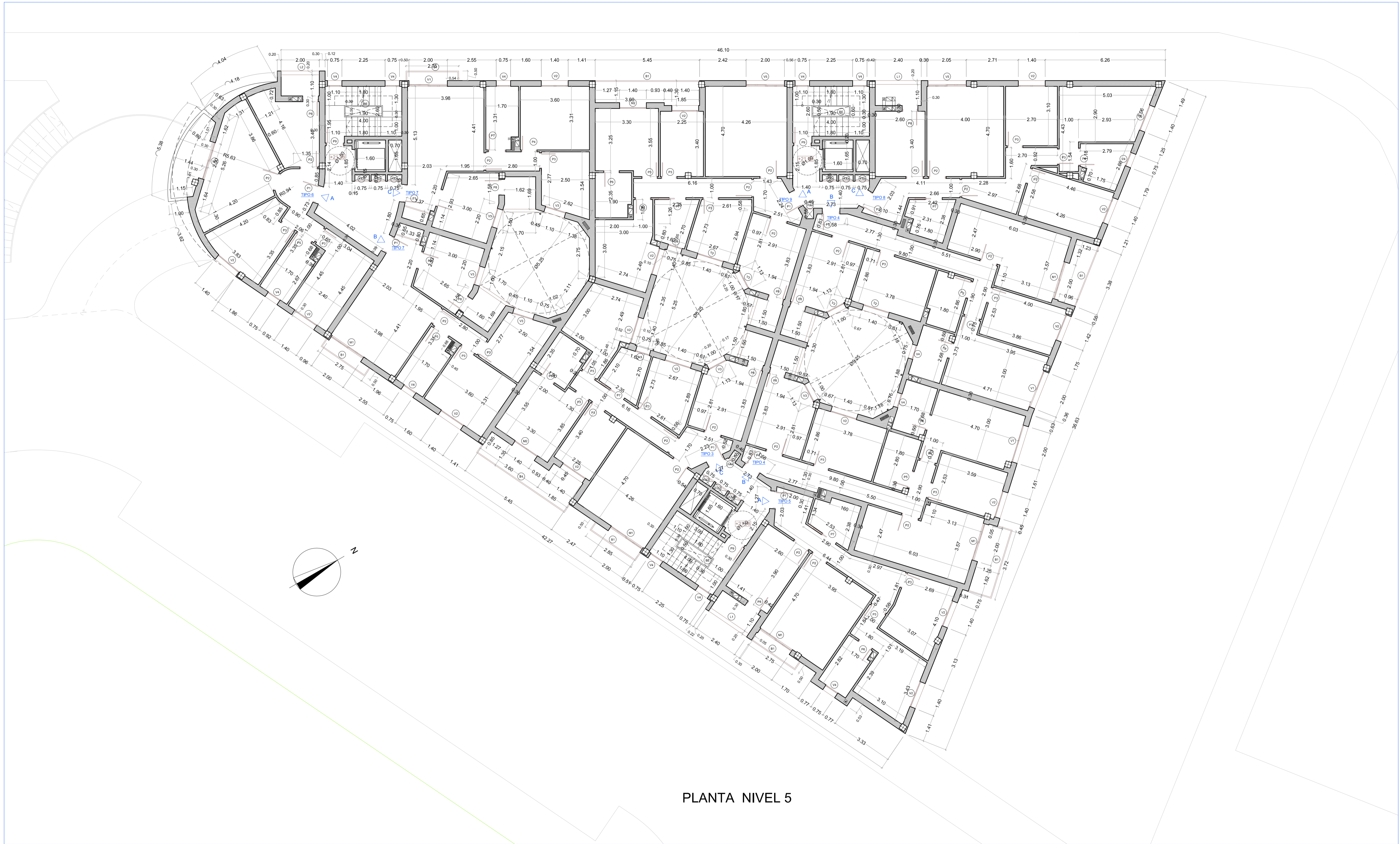
PLANTA NIVEL 5

CIUDAD AUTONOMA DE MELILLA EMVISMESA EMPRESA MUNICIPAL DE LA VIVIENDA Y SUELO DE MELILLA