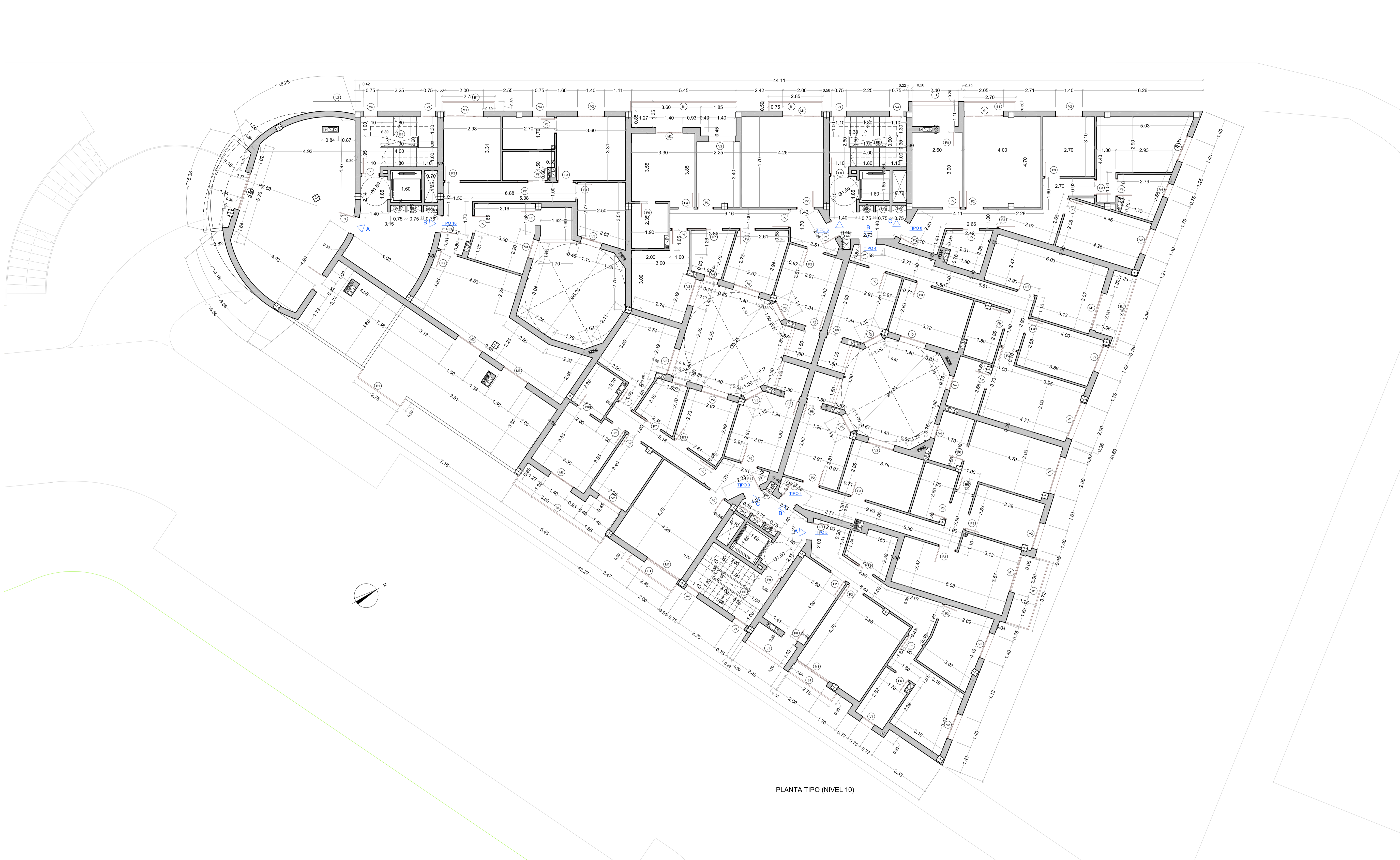
PLANTA TIPO (NIVEL 10)