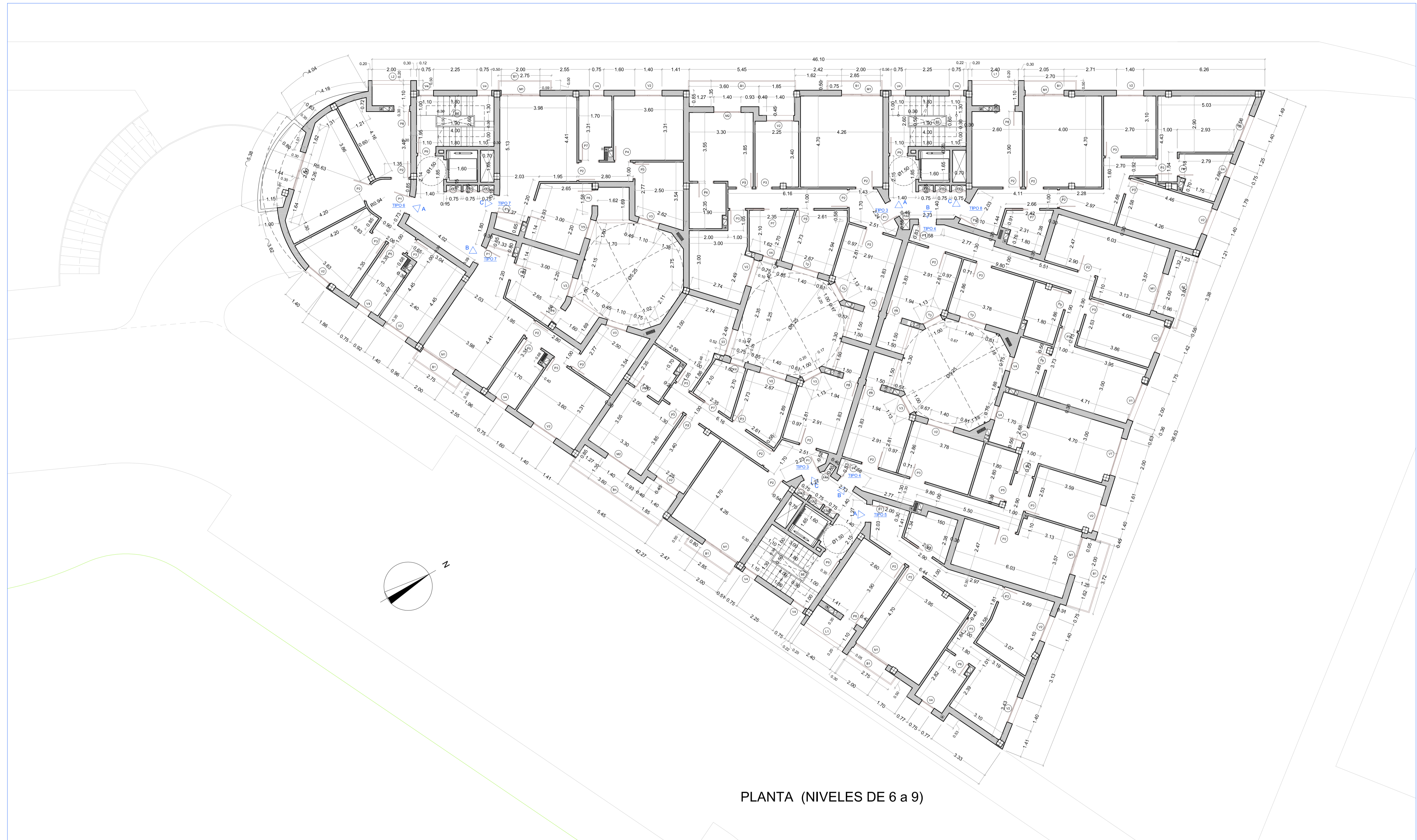
PLANTA (NIVELES DE 6 a 9)

CIUDAD AUTONOMA DE MELILLA EMVISMESA EMPRESA MUNICIPAL DE LA VIVIENDA Y SUELO DE MELILLA