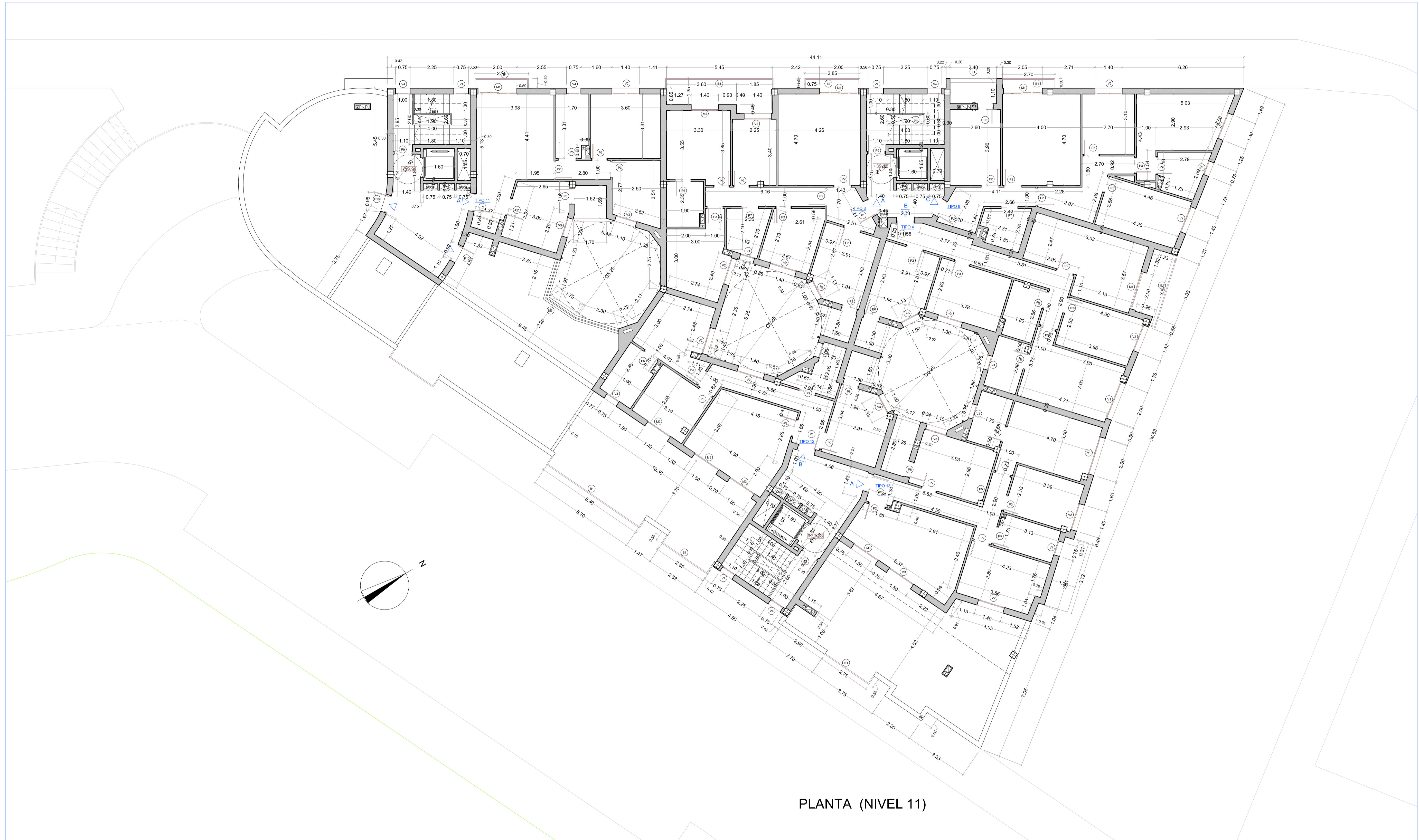
PLANTA (NIVEL 11)