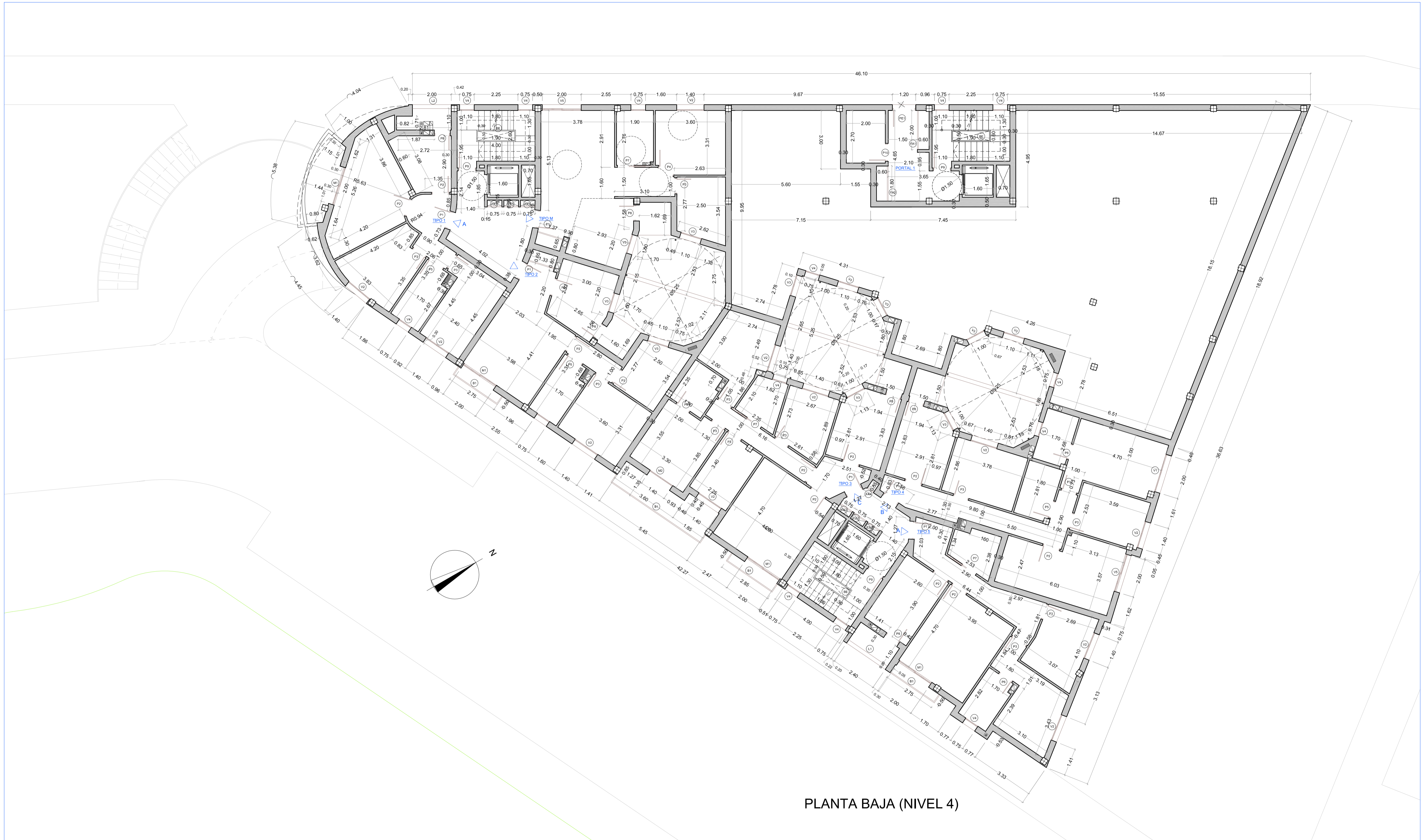
PLANTA BAJA (NIVEL 4)

CIUDAD AUTONOMA DE MELILLA EMVISMESA EMPRESA MUNICIPAL DE LA VIVIENDA Y SUELO DE MELILLA