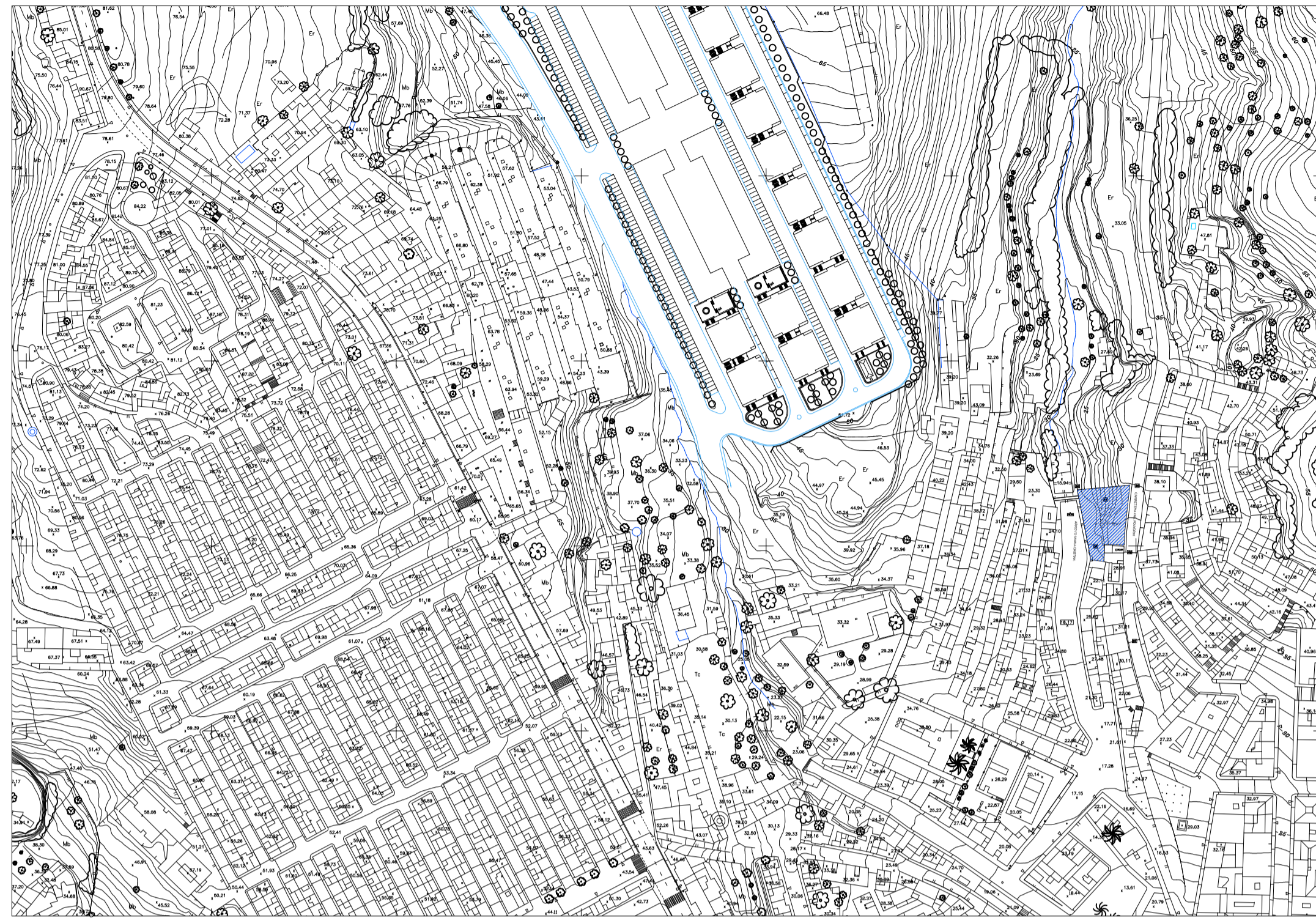
SITUACION EN LA CIUDAD E= 1/2500