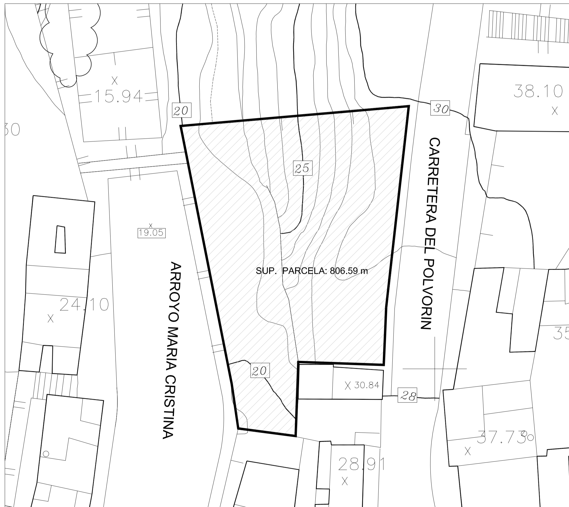
ESTADO ACTUAL E=1/250