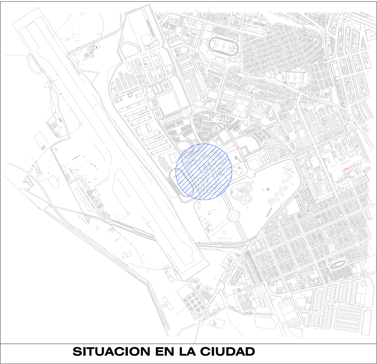
SITUACION EN LA CIUDAD