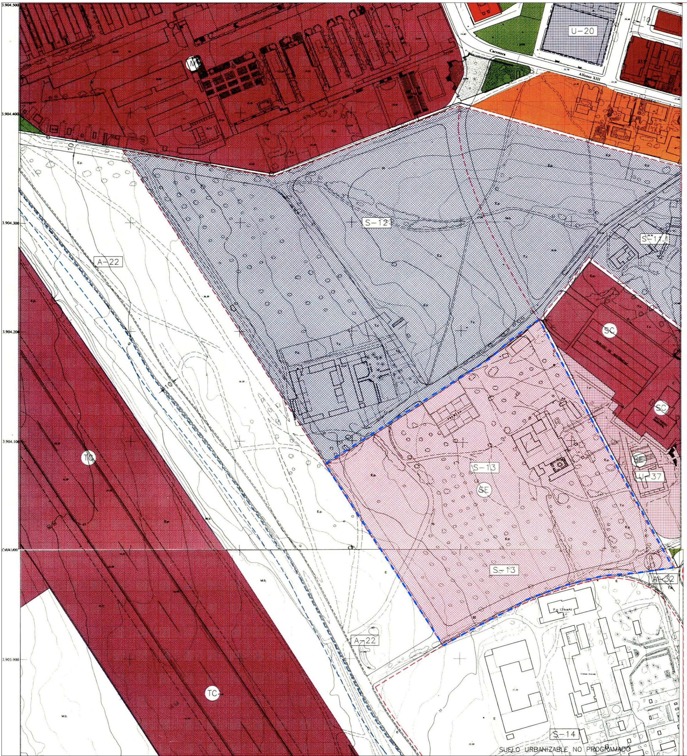
CALIFICACION EN EL P.G.O.U. 1: 2.000